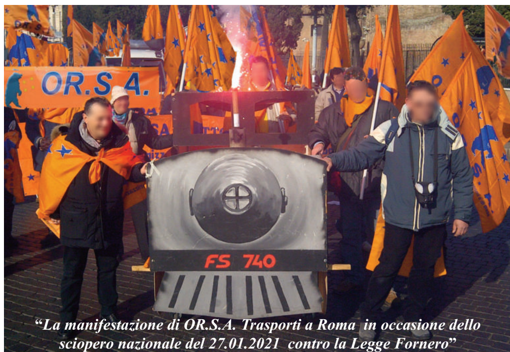
“La manifestazione di OR.S.A. Trasporti a Roma in occasione dello sciopero nazionale del 27.01.2021 contro la Legge Fornero”

Eppure qualche affinità sembra esistere se è vero che i lavoratori dei trasporti, mentre andiamo in stampa, non sanno ancora quando saranno vaccinati e per paradosso questo può pure essere preso come un passo avanti rispetto a qualche mese fa quando solo l'OR.S.A. Trasporti poneva il problema della priorità vaccinale per questo settore. Oggi, la mobilitazione e l'impegno del Sindacato ha fatto passare il principio che dopo gli anziani ed i fragili chi va vaccinato per primo è colui che offre un servizio alla collettività esponendosi in prima persona. Manca l'ultimo miglio, direbbero i ferrovieri, ma il tempo è ingeneroso e si rischia che il Capo Treno, l'autista di autobus o l'addetto allo sportello di biglietteria vengano prima vaccinati al palasport