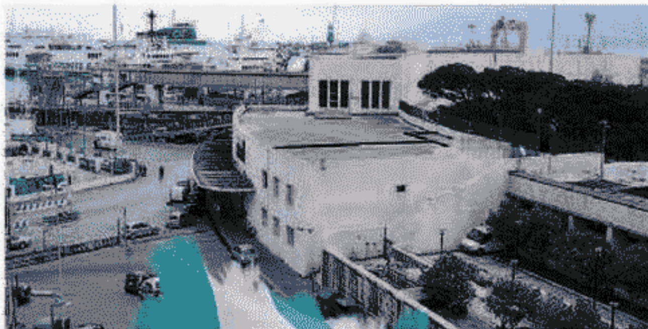
La Stazione marittima oggetto di un concorso internazionale

Il concorso si svolgerà in due fasi. Nella prima la com-