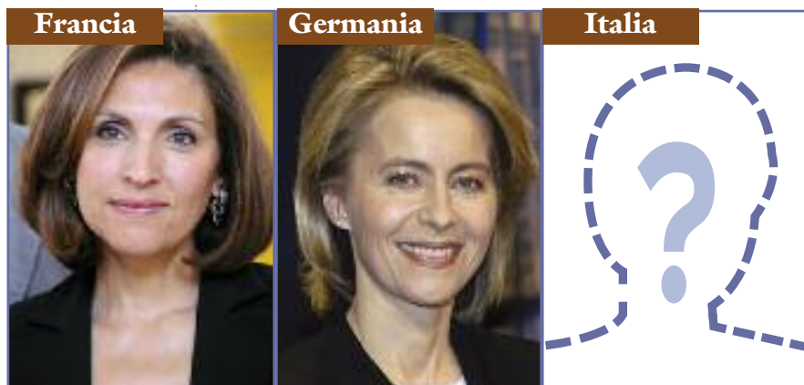
Nora Berra Segretaria di Stato per gli anziani

Dei 56 milioni 108 mila cittadini italiani residenti al 1° gennaio 2010, ben 12 milioni 200 mila sono concentrati nella fascia di età che va dai 65 anni ed oltre. Mentre la popolazione di giovani decresce continuamente, aumenta invece sensibilmente l'incidenza delle classi degli anziani. La quota sopra gli 80 anni subi-